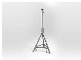
HS08LR Chandelle, 8,2 T, 1260-1990 mm