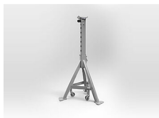
MS08LR Chandelle, 8,2 T, 790-1270 mm