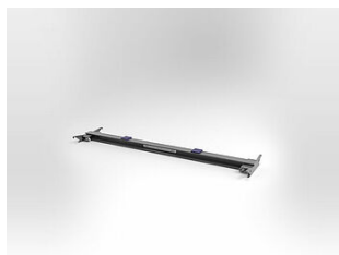
EHB905TR113000 Traverse, 11 T, longueur 3000 mm