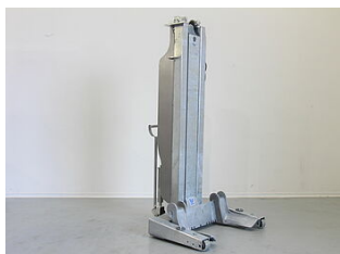
EHB907DC01-H-VZ Galvanisation pour colonne EHB90xDC